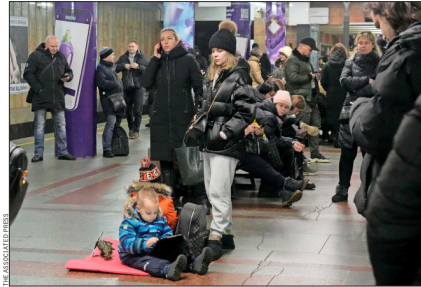
EN KIEV, civiles se refugiaron en estaciones del metro para protegerse de los bombardeos lanzados por Rusia ayer.

A pesar de que las fuerzas ucranianas lograron derribar la gran mayoría de los misiles, se registraron impactos en distintos puntos de Kiev, Járkov (este), y las sureñas Zaporizhia y Krivói Rog. En esta última, las autoridades registraron la muerte de al menos tres civiles, tras el impacto de un misil ruso contra un edificio residencial, además de señalar que la ciudad se quedó sin eléctri-