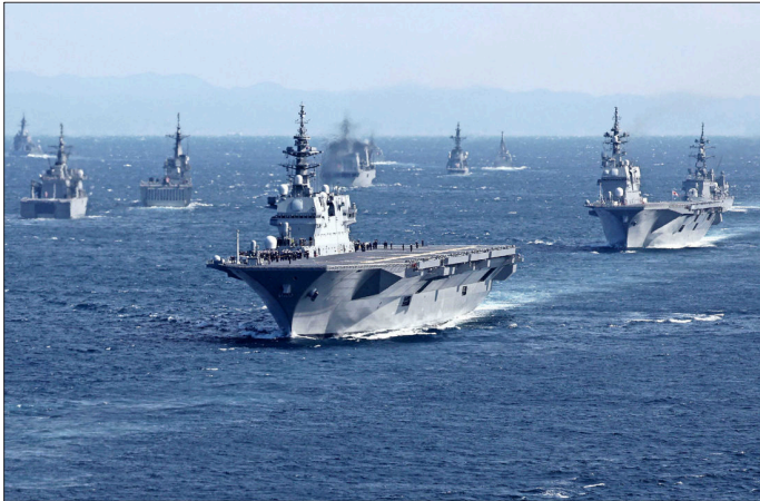
JAPÓN ha potenciado sus FF.AA. en los últimos años. En la foto, buques de la Fuerza Marítima de Autodefensa.

“El rearme de Japón definitivamente está diseñado para contrarrestar el poder creciente de China, que su Estrategia de Seguridad Nacional designa como un